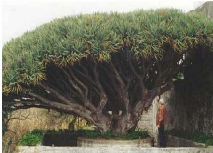
Figura 2: Dragoeiro. Quinta do Jardim (Árvore de interesse público)