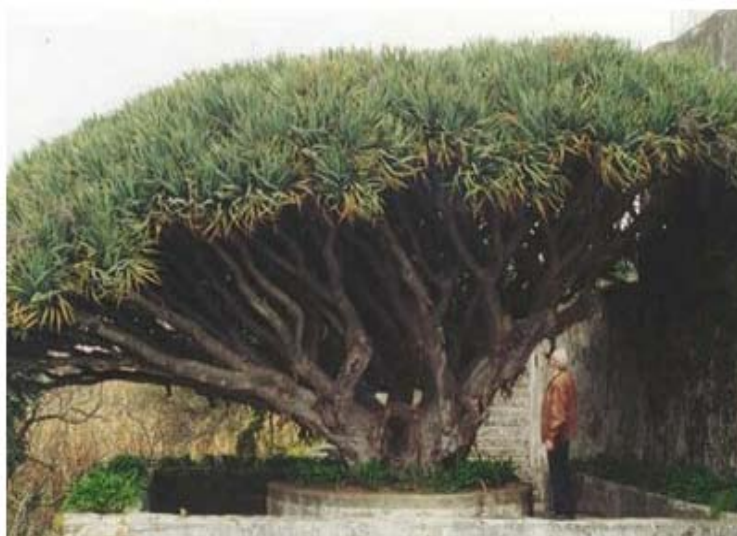
Figura 2: Dragoeiro. Quinta do Jardim (Árvore de interesse público)

- http://www.afn.min-agricultura.pt/portal/dudf/pndfci